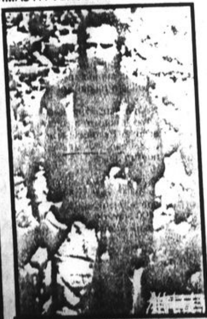
GUILLERMO LOBATON MILLA , Primer Comandante y Jefe de la Guerrilla "Túpac Amaru".