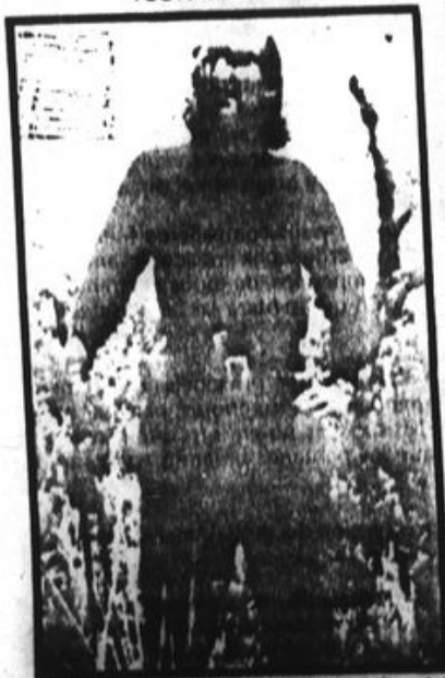
LUIS FELIPE DE LA PUENTE UCEDA , Jefe de la Guerrilla "Pachacutec" y Comandante General del MIR.

CON LAS MASAS Y LAS ARMAS ... VENCEREMOS!