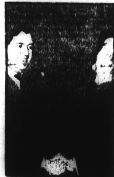
DE LA MANO CON EL YANKI—VICE- SECRETARIO DE ESTADO USA